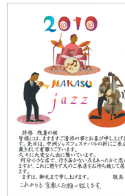
▲後日、中洲の飲食店からお礼状が届きました。

私は、各地区の飲食街でも、このような催しを実施すると、飲食街のことも知ってもらえ、街も活気づき、お客様も楽しめるのではないかと思います。