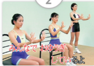
みんなで歌謡体操 しているよ