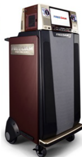
▲ 定価 1,500,000円