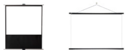
● KG-S2100 ● KG-SK80W