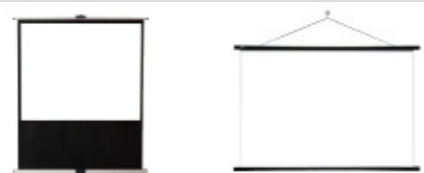
● KG-S2100 ● KG-SK80W